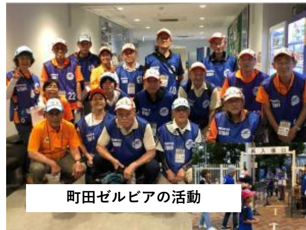
町田ゼルビアの活動