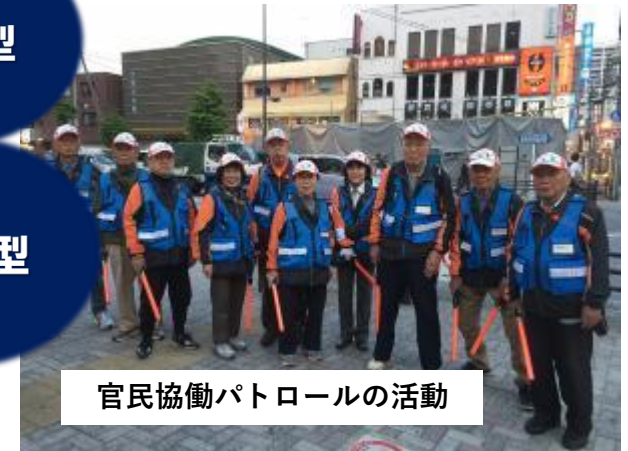
官民協働パトロールの活動