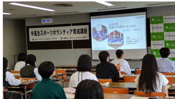
中高生スポーツボランティア育成講座の開催