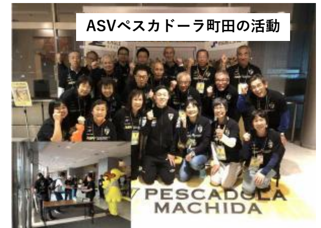
ASVペスカドーラ町田の活動