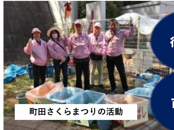
町田さくらまつりの活動