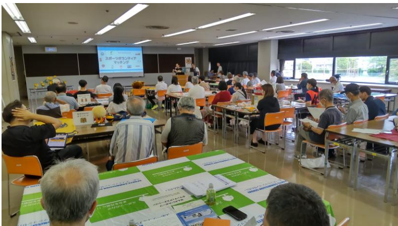
スポーツボランティア・マッチングの開催